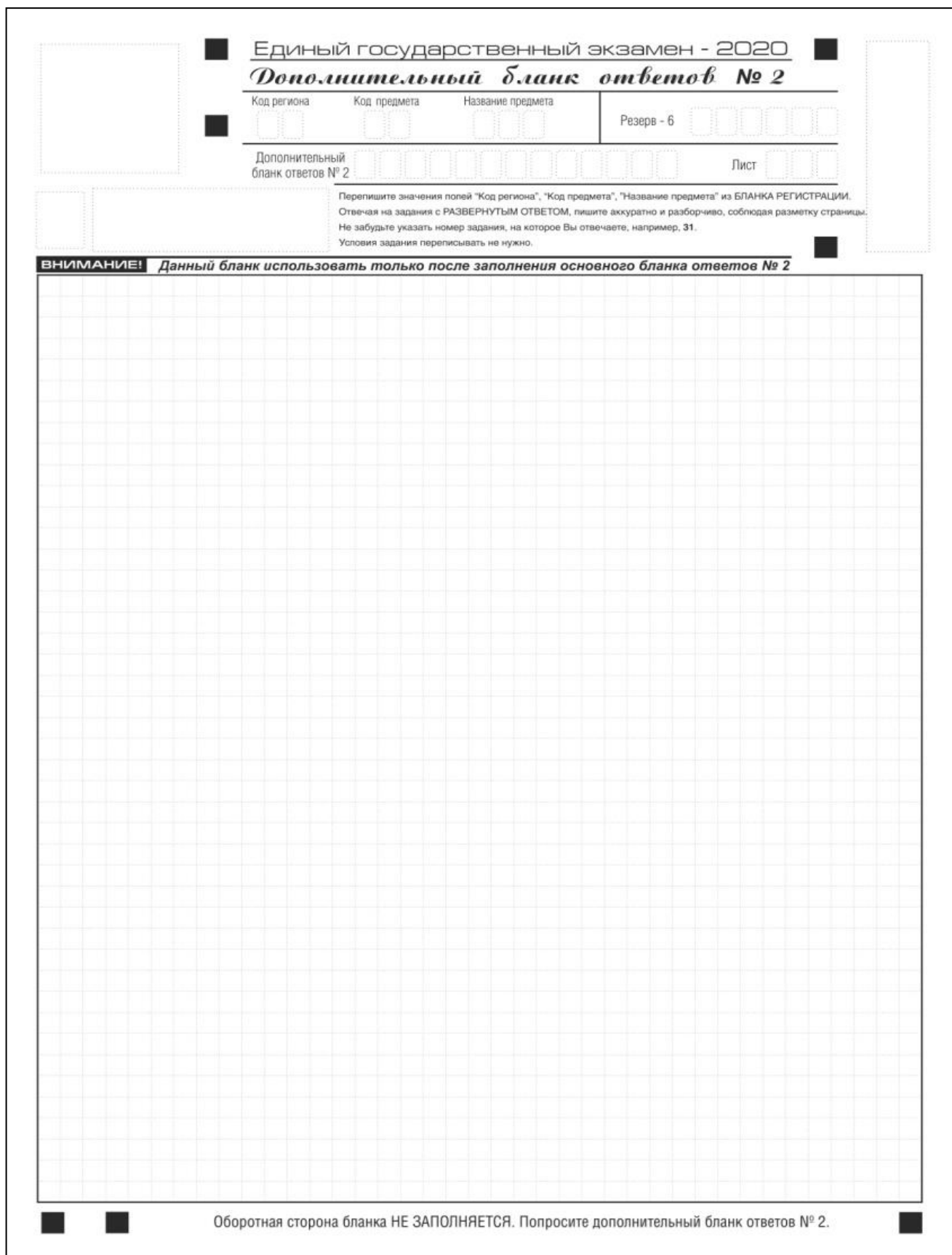
Рис. 15. Дополнительный бланк ответов № 2